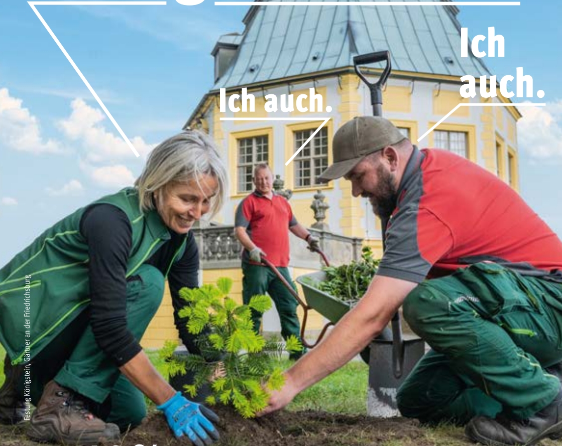
Festung Königstein, Gärtner an der Friedrichsburg

Bis zu 40 % deines Einsatzes sind ein Gewinn für das Gemeinwohl in Sachsen.