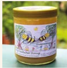
Honig aus dem KGV am Geberbach

Geprägt ist die Entstehungsgeschichte des Vereins vor allem durch den unermüdlichen Kampf