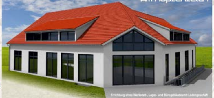
Einrichtung eines Werkzab-, Lager- und Bürogebäudes mit Ladungsschiff