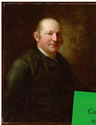
Das restaurierte Palitzsch-Gemälde von Anton Graff, 1777, Foto: Staatliche Kunstsammlungen Dresden

In diesem feierlichen Rahmen wurde auch der überarbeitete Roman „Comet und Morgenthau“