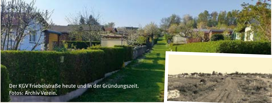
Der KGV FriebeIstraße heute und in der Gründungszeit.